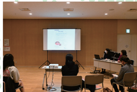
『2023年度 さくらチャレンジプロジェクト報告会』の様子