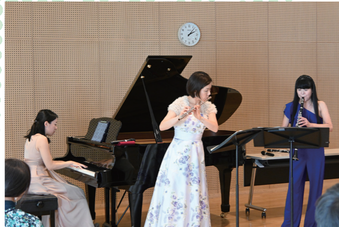
M's music 「0歳からの親子で楽しめるコンサート」 「クラシック名曲コンサート」