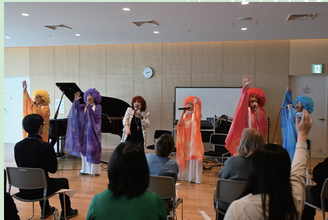
プレーメン 「みんなで歌おう♪1日限りのゴスペルワークショップ♪」