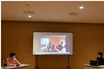
『2022年度 さくらチャレンジプロジェクト報告会』の様子

※詳細は採択時にお渡しする資料に同封いたします。 ※本報告会は採択団体に加え、一般の来場者への公開も予定しております。