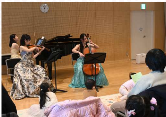
M's music 「0歳からOK！親子で楽しめる名曲ファミリーコンサート」