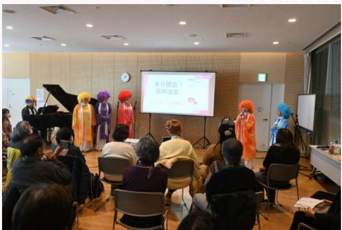
横浜 Fun★key Singers 「本日開店！歌声喫茶 ファンキーズと歌おう！」