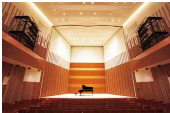
音響反射板を有した約450席のホールです。これまで多くの演奏家にご利用いただき、その豊かな響きにご好評をいただいております。