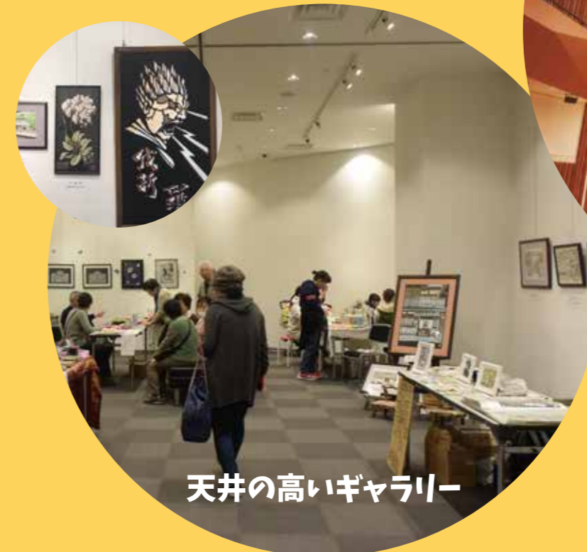
天井の高いギャラリー