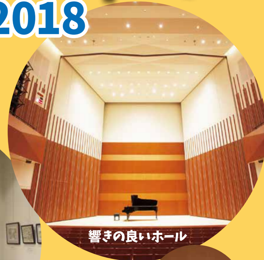
響きの良いホール