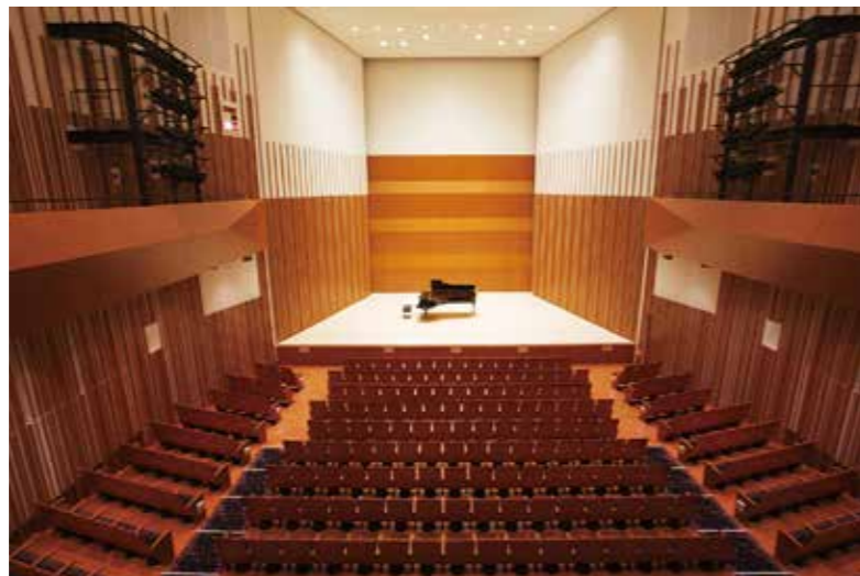
音響反射板を有した約450席のホールです。 これまで多くの演奏家にご利用いただき、その豊かな響きにご好評をいただいております。