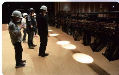
3/10(金) アートマネジメント講座Vol.15 / バックステージツアー

ホール舞台裏をスタッフのガイド付きで見学。照明機材や織機などを間近で見たり、天井裏から客席をのぞいてみたり。普段客席側からは見えない部分に興味津々。なんと、同日開催の寄席の高座も参加者の皆様で組み立て、小せん師匠に実際に使用していただきました。