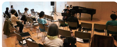
3/11(土) 第18回さくらプラザ特待生ミーティング(公開試演会)

特待生はさくらプラザで交流しながらお互いに芸術に対する意識を高めています。今回は一般の方にも特待生について知っていただきたく、普段の試演会を一般公開いたしました。アットホームな空間でそれぞれに良い演奏を披露できたことと思います。