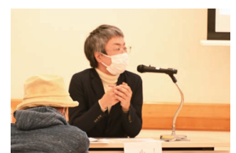
2023年2月5日に実施されたシンポジウムにて。

戸塚宿の「お札まき」で突き飛ばされながらお札を拾ったこと。舞岡の「湯花神楽」でお湯のしびきを浴びたこと。東俣野で障害のある子どもと奮闘する先生たちの笑顔。平戸台での子どもたちの演劇づくり。小雀で見た大きな夕陽。私が見てきたこうした区内各地にある豊かな地域性と文化施設は、どう関係を紡いでいけばいいのか。区民のみなさんも含めて、一緒に考えていきたいですね。