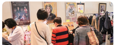
3/11(土)～3/12(日) さくらプラザマルシェ

今年のマルシェはコロナ以前の開催場所であるホール横の通路に戻ってきました。5つの出店皆様による魅力あふれるハンドクラフト作品に、多くの方が目を輝かせていました。お店の方との会話も弾み、会場は常に笑顔が溢れていました。