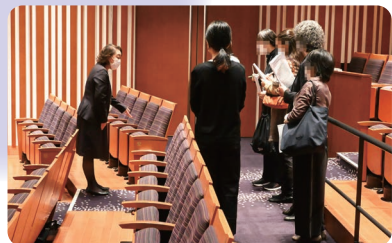
3/10(金) アートマネジメント講座Vol.16 / レセプション体験

さくらプラザ寄席「柳家小せん 独演会」のレセプション(会場内)を体験できるワークショップ。本番に向けて午前中にレセプションの勉強会を行い、午後実施体験をしました。受講者の皆様は初めてとは思えない程、スムーズにお客様のご対応をされていました。