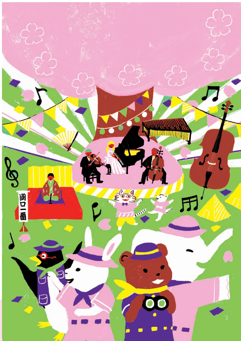
イラストレーション 小川かなこ