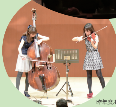
昨年度ホール出演者 vallote