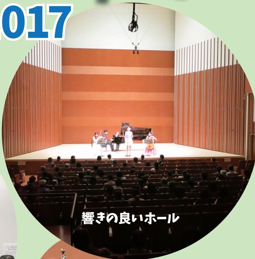
響きの良いホール