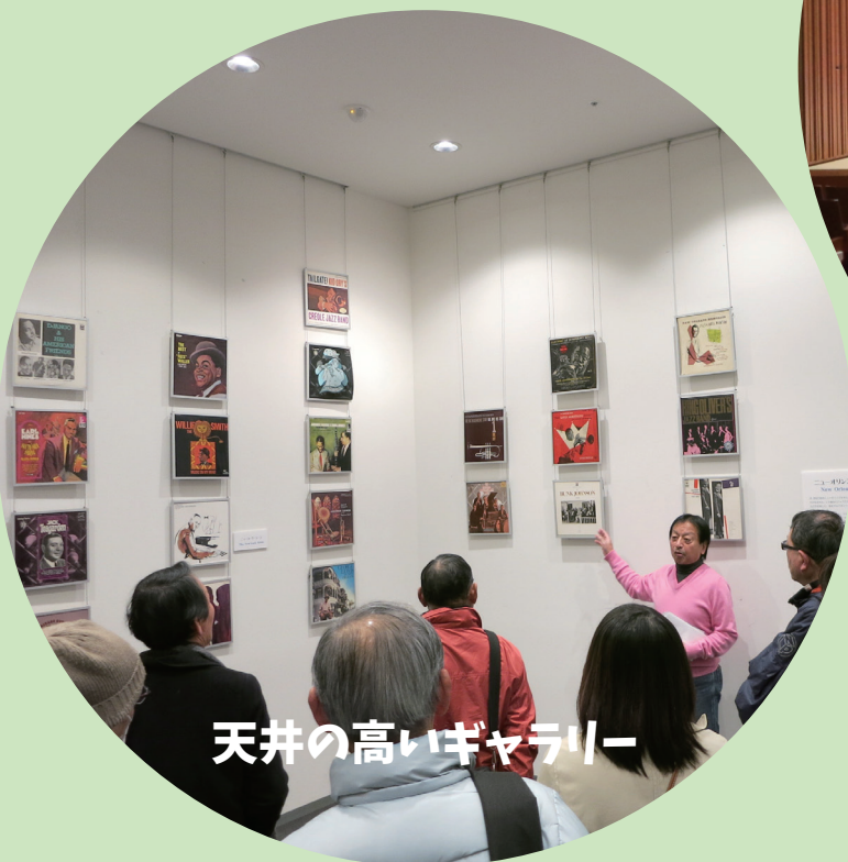
天井の高いギャラリー