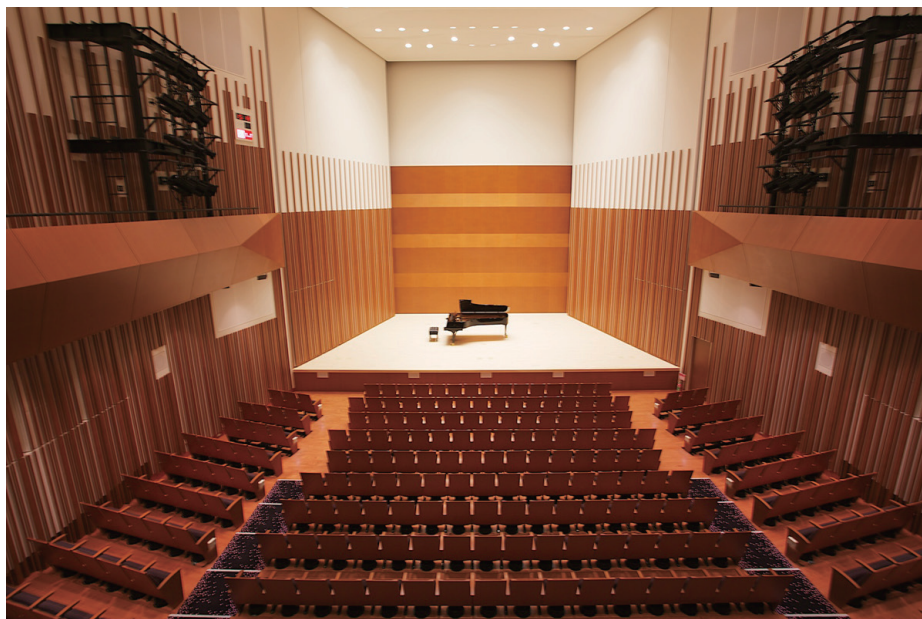
音響反射板を有した約450席のホールです。 これまで多くの演奏家にご利用いただき、その豊かな響きをご好評いただいております。

*政治・宗教・営利を目的とする活動及び公序良俗に反する作品の出演・出展はお断りいたします。